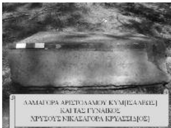
Εικ. 10. Τομέας IV (βόρειος). Ἐπιτύμβια ἐπιγραφή.

ΛΑΜΑΙΥΡΑ ΑΡΙΣΤΟΓΑΜΟΥ ΚΥΜΙ[ΣΑΛΕΣ] ΚΑΙ ΤΑΣ ΓΥΝΑΙΚΟΣ ΧΡΥΣΟΥΣ ΝΙΚΑΛΑΥΡΑ ΚΡΕΑΣΣΙ[ΟΣ]