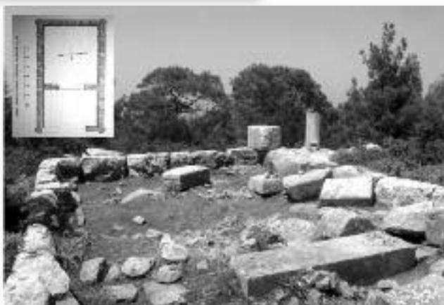
Εικ. 7. Τομέας ΙΙ (Ακρόπολη), Ναός από Α-Δ.