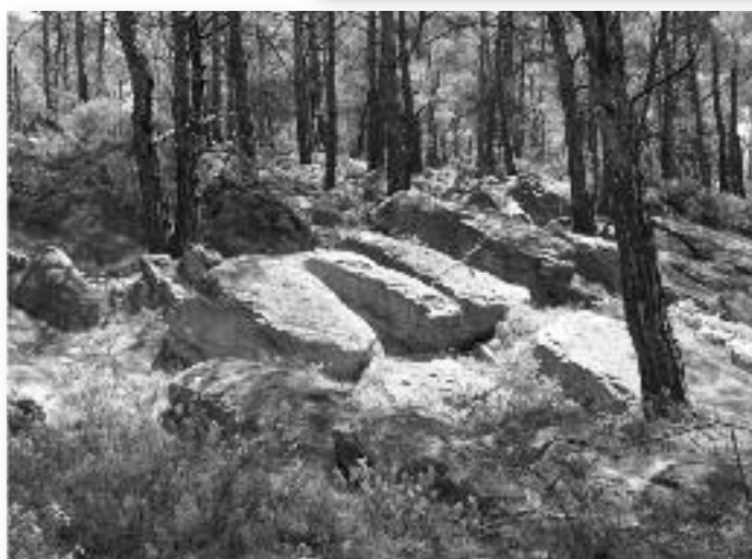
Εικ. 8. Άγ. Φωκάς, αρχαία λατομεία.