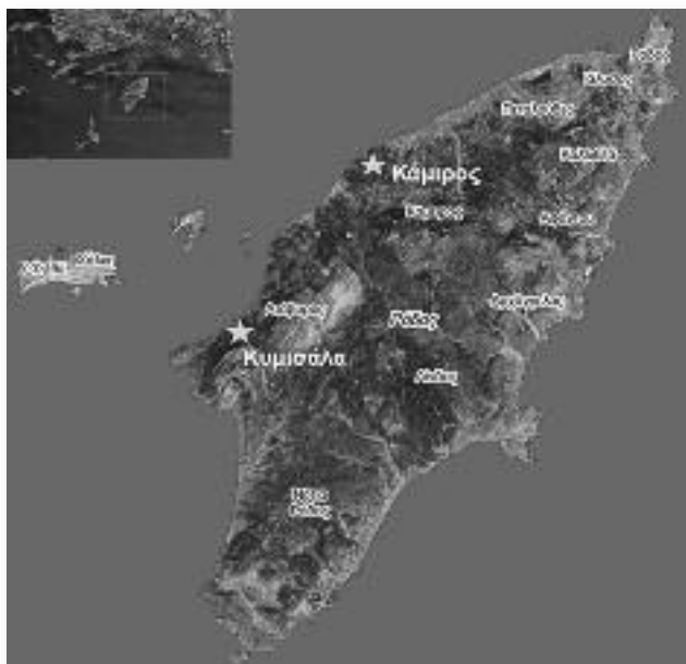
Εικ. 1. Χάρτης τής Ρόδου.