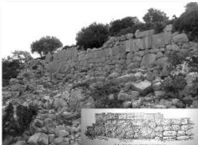
Εικ. 6. Τομέας ΙΙ (Ακρόπολη), όχυρωματικός περίβολος.