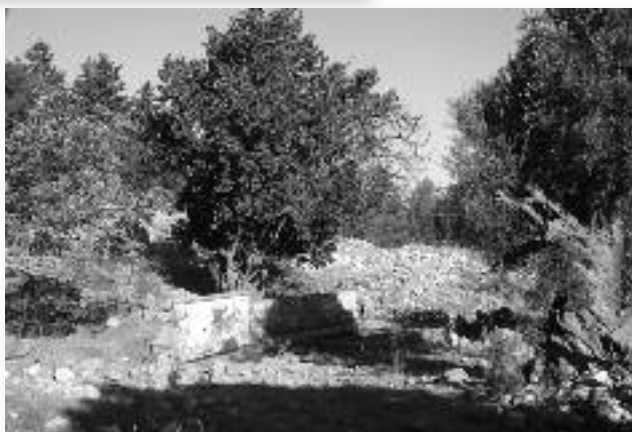
Εικ. 4. Η πηγή τῶν Στελιῶν σήμερα.